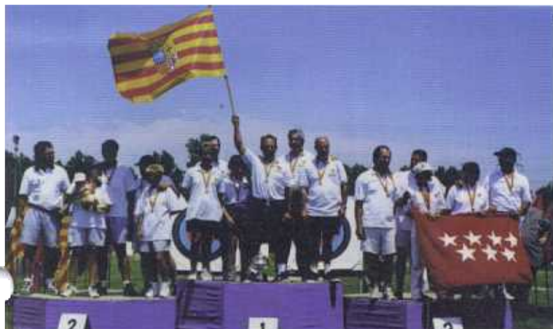
Podio Copa de S.M. la Reina: (izq a dch) Extremadura, Aragón y Madrid